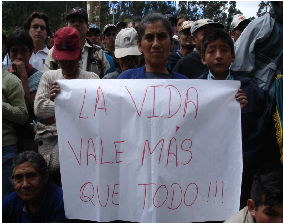
Protest gegen Bergbau in Peru

Von wenigen Ausnahmen abgesehen profitieren machtvolle Eliten und Konzerne. Die Bevölkerungsmehrheit wird nach Beginn der Erschließung und Förderung der Rohstoffe i.d.R. ärmer statt reicher. Vielfach ist ihre Existenz in Gefahr.