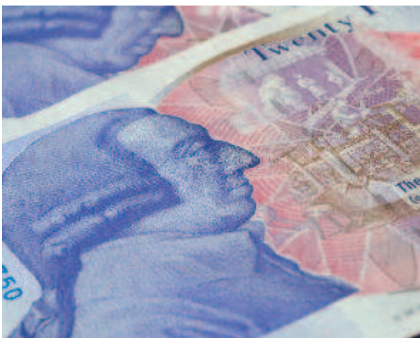
Adam Smith: Dem „Vater der Marktwirtschaft“ widmet die Bank of England seit März 2007 die 20 GBP-Note.

Galt den Keynesianern die Regierung noch als Retter, so hieß es jetzt: „Government is the problem.“ Regeln und Regierungen wurden als bürokratische Schikanen diffamiert, die historischen Ursachen ihrer Entstehung (meist vorausgegangenes Marktversagen) schlichtweg ignoriert.